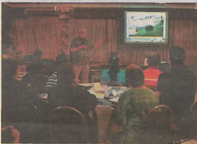
Expertos de la Universidad de Hawái dieron charlas sobre cómo prepararse para una ola gigante.